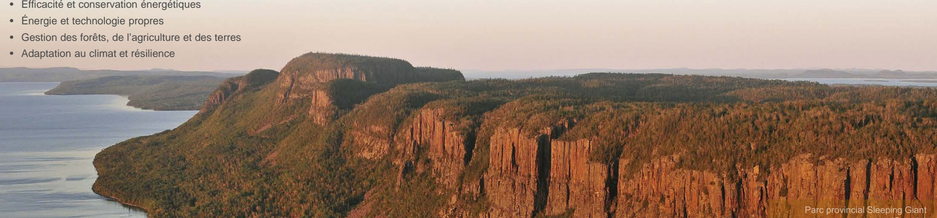
Parc provincial Sleeping Giant

La province prévoit d'émettre sa quatrième série d'obligation verte avant la fin de l'exercice 2017-2018.